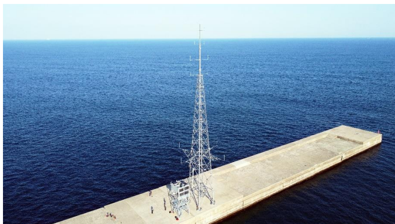
図1 洋上風況観測マスト

今後、風力発電事業の関係者、研究開発プロジェクト(風況、気象、生態系、環境など)の事業者、港湾の安全や教育に関わる地元関係者などに広く利用される試験サイトとして展開することを目指し、風況観測の精度を向上させることで洋上風力発電をはじめとする再生可能エネルギーの導入促進および地域社会の発展に貢献します。