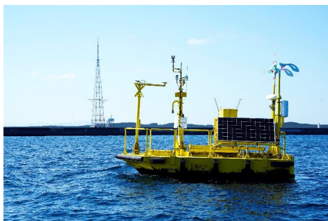
図 3 フローティングライダー ※2 による観測の様子