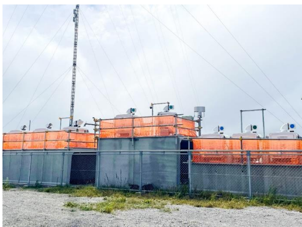
図 2 スキャニングライダー ※1 用の架台